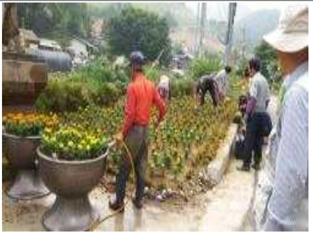
환경정비(마을 꽃길 조성)