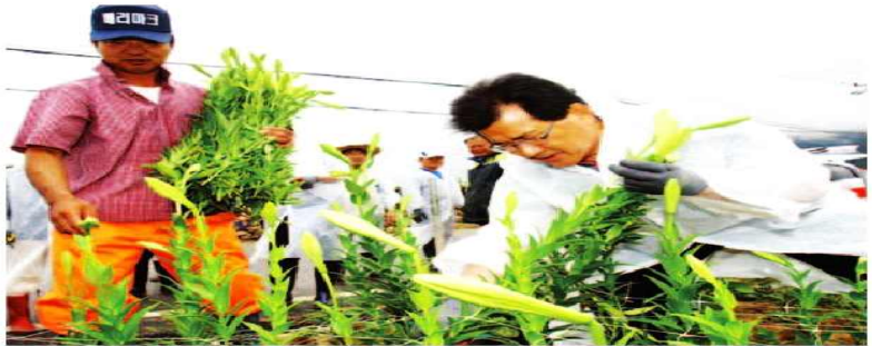
이시종 지사가 지난 2일 진천군 이월면 소재 백합 재배 농가에서 생산적 일손봉사 활동을 벌이며 구슬땀을 흘리고 있다.

진천 등에서 2100명 참여를 목표로 시작한 이 사업은 참여 자원봉사자는 물론 일손이 부족한 농가와 기업에서 호응도가 좋아 같은 해 7월부터 도내 전 시군으로 확대됐다.