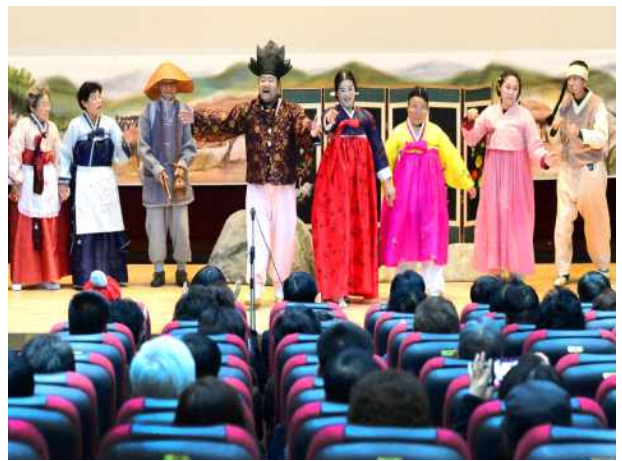
학습활동(마을민 마당극 공연)